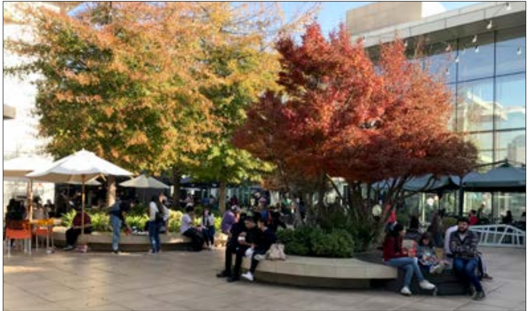
A unas cuerdas de Edificio Vista Egaña se encuentra el Mall Plaza Egaña con una gran oferta gastronómica y amplias terrazas.

Al frente, en la Plaza Egaña existen otros datos recomendados, como el restaurante