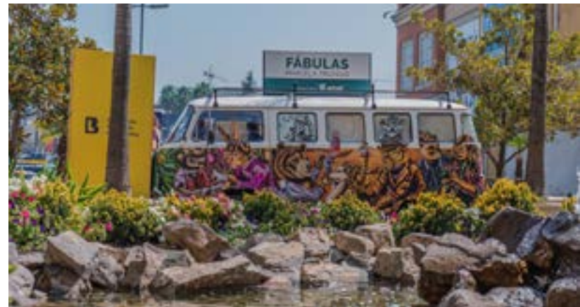
Hasta Lo Barnechea llegó la Combi del Arte.

Asimismo, gracias a dos importantes alianzas entre Fundación Actual y Fundación Cultural de Santiago, por un lado, y con la Corporación Cultural de Lo Barnechea, por otro, la Combi se emplazó en Av. Andrés Bello, al lado del Parque Forestal, en el programa “Calles Abiertas”; y estuvo instalada en el Portal La Dehesa y en el Centro de las Tradiciones, en Lo Barnechea, en el contexto de la “Semana