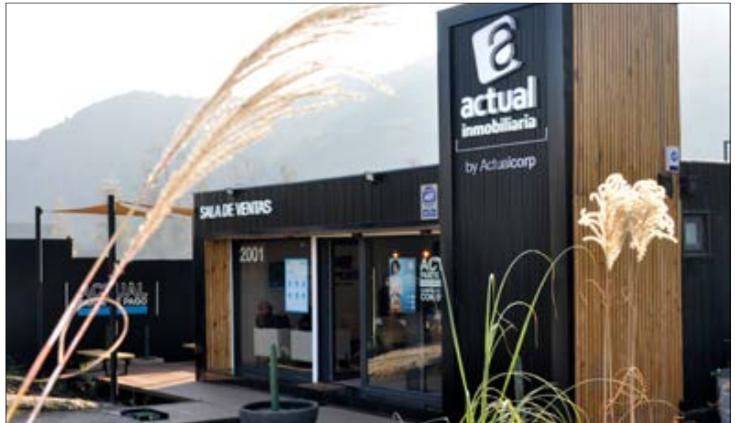
Compruebe toda la comodidad que ofrece la sala de ventas del Condominio Piamonte en Huechuraba.

E n un gran jardín, donde pueden entretenerse los niños y disfrutar de una terraza deck mientras los padres son atendidos por nuestros ejecutivos, se emplaza la sala de ventas de Condominio Piamonte, cuya apertura fue hace algunos