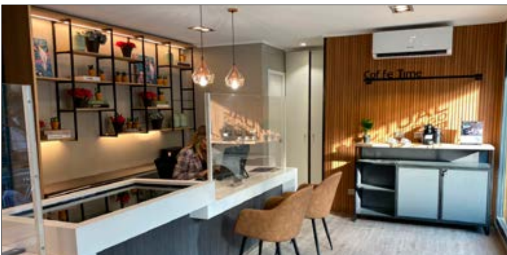
Recientemente inaugurada, la sala de venta del Edificio Hernán Cortés en Ñuñoa está diseñada pensando en mejorar la experiencia de compra de los clientes Actual.

Invitamos a conocer esta propuesta moderna en un barrio tradicional, visitando la nueva sala de venta, sin necesidad de agendamiento previo