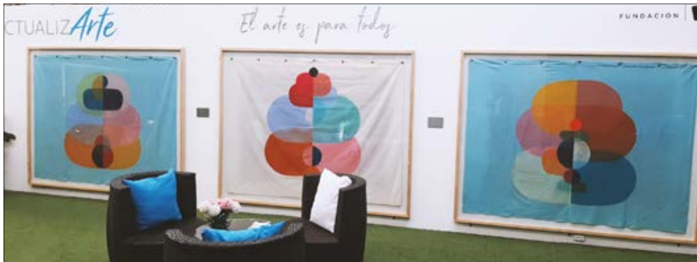
En la sala de venta se exhibe la obra de la artista que será parte del edificio.