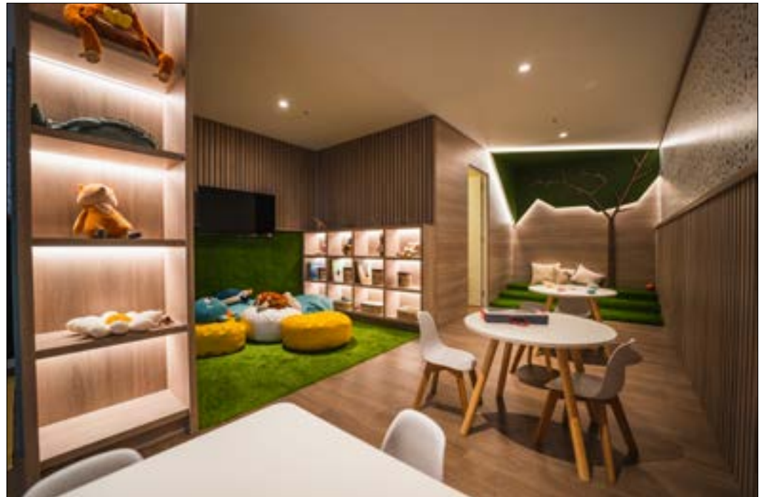
Las áreas comunes de Edificio Piura son altamente valorados por los clientes y visitantes.

Además del barrio donde está emplazado, Edificio Piura destaca por su arquitectura, calidad de construcción y diseño. Tiene departamentos de 1, 2 y 3 dormitorios, con finas terminaciones. Por ejemplo, superficies de cuarzo en cocina y baños, junto con piso SPC resistente al agua en el resto de las habitaciones. Otro de-