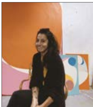
El proceso creativo de “Banderas de Balance” nació a partir de la búsqueda de equilibrio de la propia artista.

La serie de pinturas “Banderas de balance”, creadas por la artista acompañan día a día a