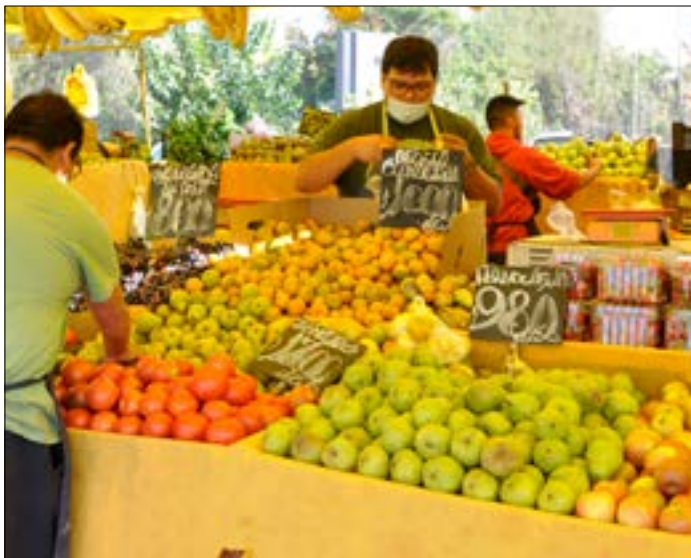
La feria dominical en Tobalaba a pasos del edificio, es una feria modelo, ofrece frutas, verduras y pescados seleccionados. Todo muy ordenado, limpio, seguro y a buen precio, además cuenta con estacionamientos.

Son familias que llevan décadas viviendo en esta zona de la comuna y que la han visto desarrollarse. Los nuevos proyectos inmobiliarios, en tanto, han atraído a parejas, universitarios e inversores que han decidido comprar una vivienda en un lugar que es una apuesta segura.