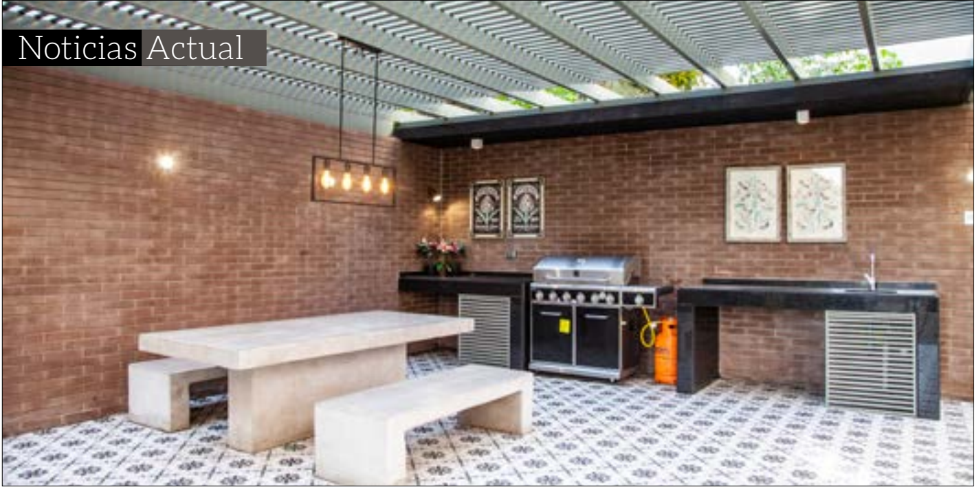
Edificio Los Clarines en Macul, nuevo foco de interés inmobiliario.