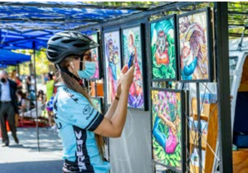
La exposición "Fábulas" recorrió Santiago desde diciembre 2019 a marzo 2022.

A nimales vestidos de chaqueta y corbata, en actitudes sumamente humanas, e inmersos en paisajes casi psicodélicos. Son los zorros, conejos, cabras y perros ilustrados por la célebre artista chilena Marcela Trujillo (Maliki), que fueron los protagonistas de una singular actividad creativa sin precedentes en la escena artística chilena.