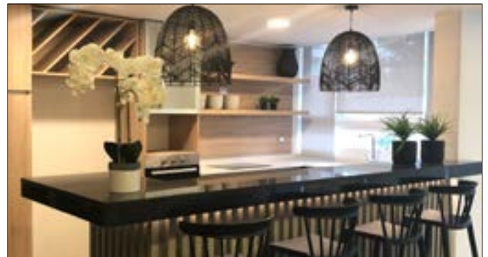
Edificio Campoamor en Ñuñoa, una de las comunas más cotizadas por los inversionistas.

Por eso, infórmese de los últimos departamentos disponibles en los mejores edificios de la inmobiliaria.